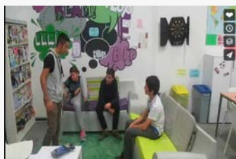
GUK ARGI DAUKAGU