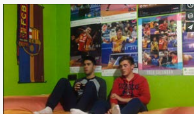
ALDATZEKO ORDUJA DA