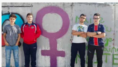
ESKERRIK ASKO EZER EZ ESATEAGATIK