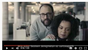
WHO WILL YOU HELP